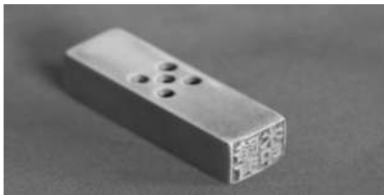
路有水的书信盒及印章

路有水，别号路虎子，他曾率领一只200余人的队伍，在冀鲁边区进行抗日斗争，令敌人闻风丧胆，留下许多传奇。