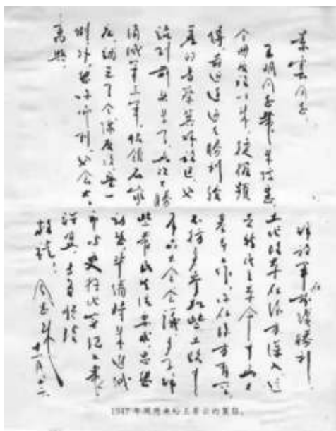
1947年周恩来给王景云的信