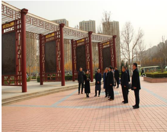
山东省水利技师学院来校考察

“德能”文化育人品牌效应显著。学校“德能”文化育人案例被省教育厅评选为职业院校文化建设优秀案例。德州扒鸡、德州黑陶、德州运河菜、开放型新木艺、德州窑红绿彩瓷等被评选山东省技艺技能传承平台、中华优秀传统文化传承教育基地。面向全国推广专著、教材20本，省内外高中职学校来校考察学习93次，《中国教育报》、《大众日报》、学习强国平台等知名媒体报道500余次，“德能故事”声名远播，在全国产生广泛影响。