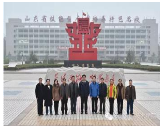
黑龙江佳木斯职教集团来校考察